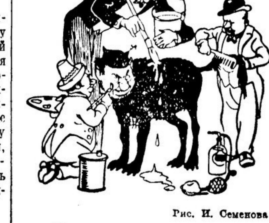
Рис. П. Семенов

Англо-американский блок пытается прогнуть Франкострану Испанию в ООН. Черного кобеля не отмыть добела. (Русская народная пословица)